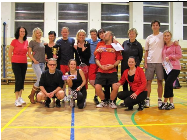
Vánoční turnaj v badmintonu 2014.