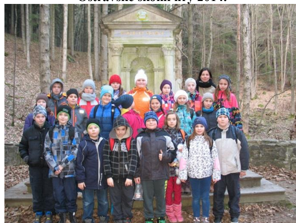
Ozdravný pobyt - lázně Jeseník 2014.