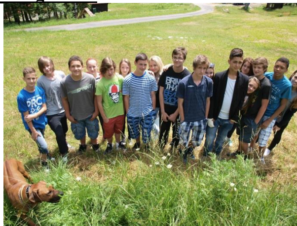
ŠVP Bílá 2014.