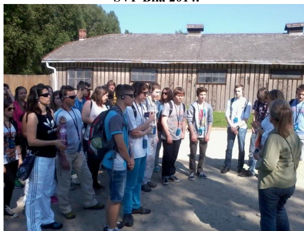
Exkurze Osvětim 2014.