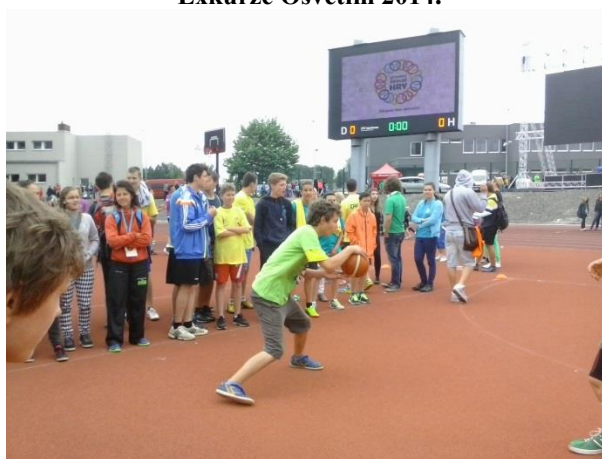
Ostravské školní hry 2014.