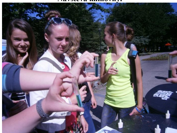
Badatelský svět 2014.